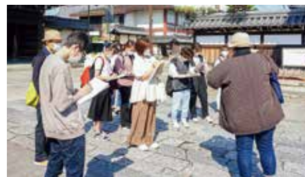
一身田寺内町の見学

当日は、ボランティアガイドの方々に寺内町をご案内いただき、古くからの町並みに触れながら歴史や伝統を学びました。また、高田会館では、寺内町や近隣地域でどのように暮らしてきたかをお話しいただいたり、学生の質問に答えていただいたりと、地域への理解を深める貴重な機会となりました。