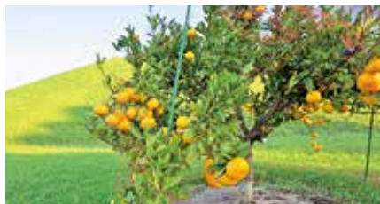
実ったみかん(10月撮影)