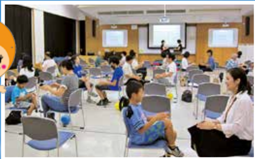
第1回公開講座(9月3日)(5頁)