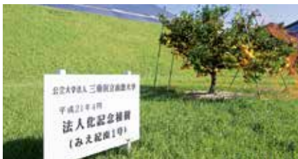
法人化記念植樹看板