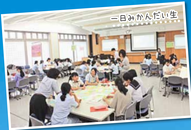
一日みかんだい生