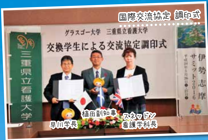
国際交流協定 調印式