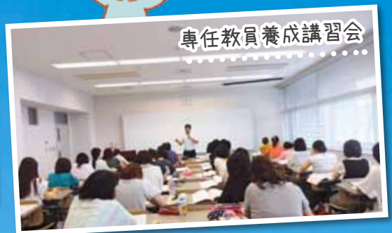
専任教員養成講習会