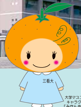
大学マスコット キャラクター 「みかんちゃん」